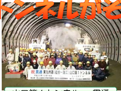
山口第1トンネル…貫通