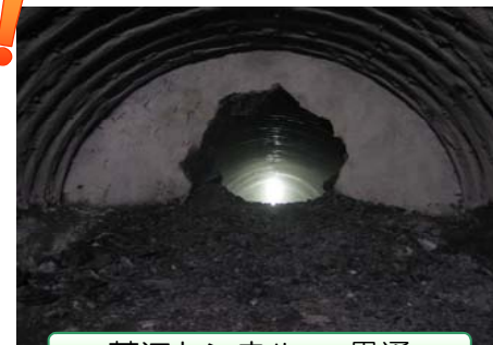
蒲江トンネル…貫通

平成25年10月31日(木)谷川トンネル(延長:261m)、12月18日(水)山口第一トンネル(延長:341m)で、施工業者主催による貫通作業報告会が、地元の方々をお招きして開催されました。