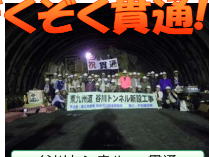
谷川トンネル…貫通